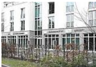
Lippertor 1, 59555 Lippstadt