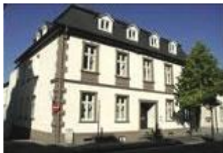
Königstr. 12, 59821 Arnsberg