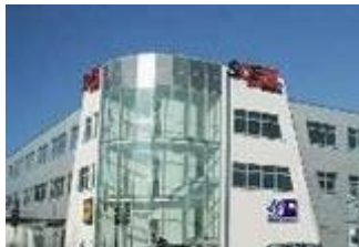
Opmünderweg 73 , 59494 Soest